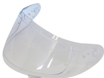
183200421 V-12 BLANK