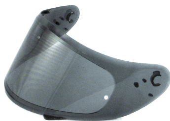
183200422 V-12 DARK