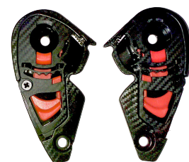
180100402 V-12 VISOR MECHANISM