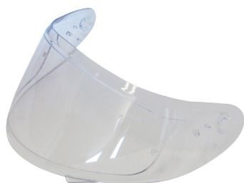
183200421 V-12 CLEAR