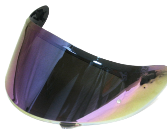
183200424 V-12 IRIDIUM