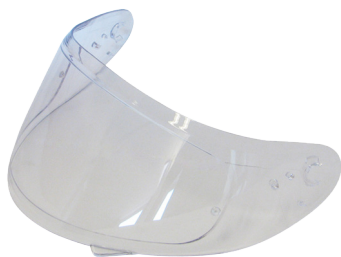
183200421 V-12 BLANK