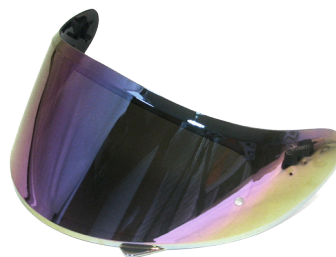
183200424 V-12 IRIDIUM