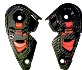
180100402 MECHANISMUS V-12 VISIEREN