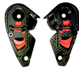
180100402 MONTAGE-SET V-12 VIZIERN